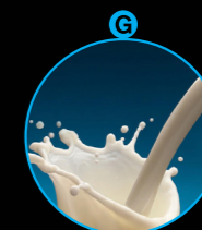
Milch von Säugetieren und Milcherzeugnisse (inklusive Laktose)