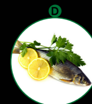
Fisch- und Fischerzeugnisse (außer Fischgelatine)