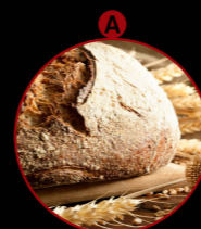
Glutenhaltiges Getreide und daraus gewonnene Erzeugnisse

Eine Nennung erfolgt, wenn die bezeichneten Stoffe oder daraus hergestellte Erzeugnisse als Zutat im Endprodukt enthalten sind.