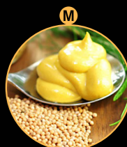
Senf- und Senferzeugnisse